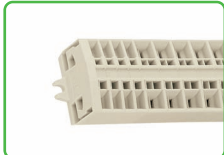
Клеммная колодка класса Ex e II с крепежными фланцами