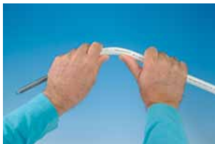
Гибка с помощью внутренней гибочной пружины