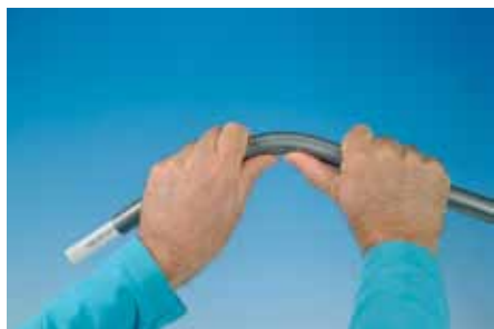
Гибка с помощью внешней гибочной пружины