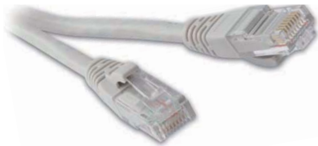
Схема: T568В, реверсивная