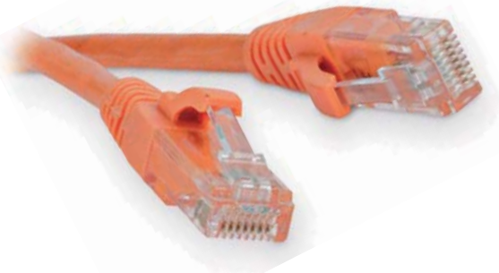
Схема: T568В, прямая