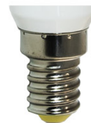
Цветовая температура: 2700K Артикул: 25513