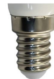
Цветовая температура: 6400K Артикул: 25518