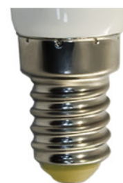
Цветовая температура: 2700K Артикул: 25516