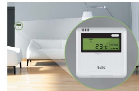
Возможность подключения проводного пульта управления*