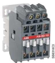
A 9-30-10 with LD 16