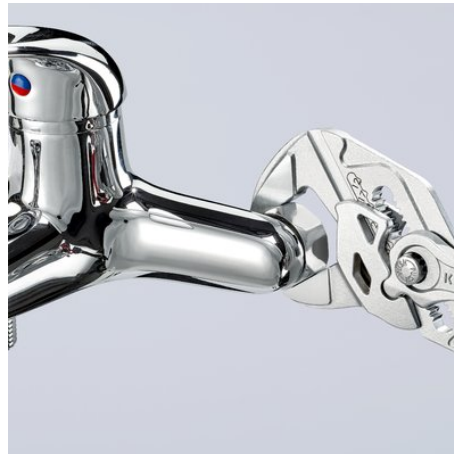
Работы на хромированных деталях без повреждения поверхности