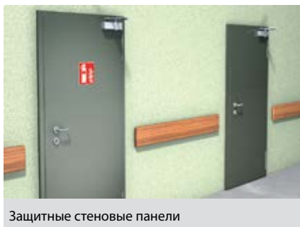
Защитные стеновые панели