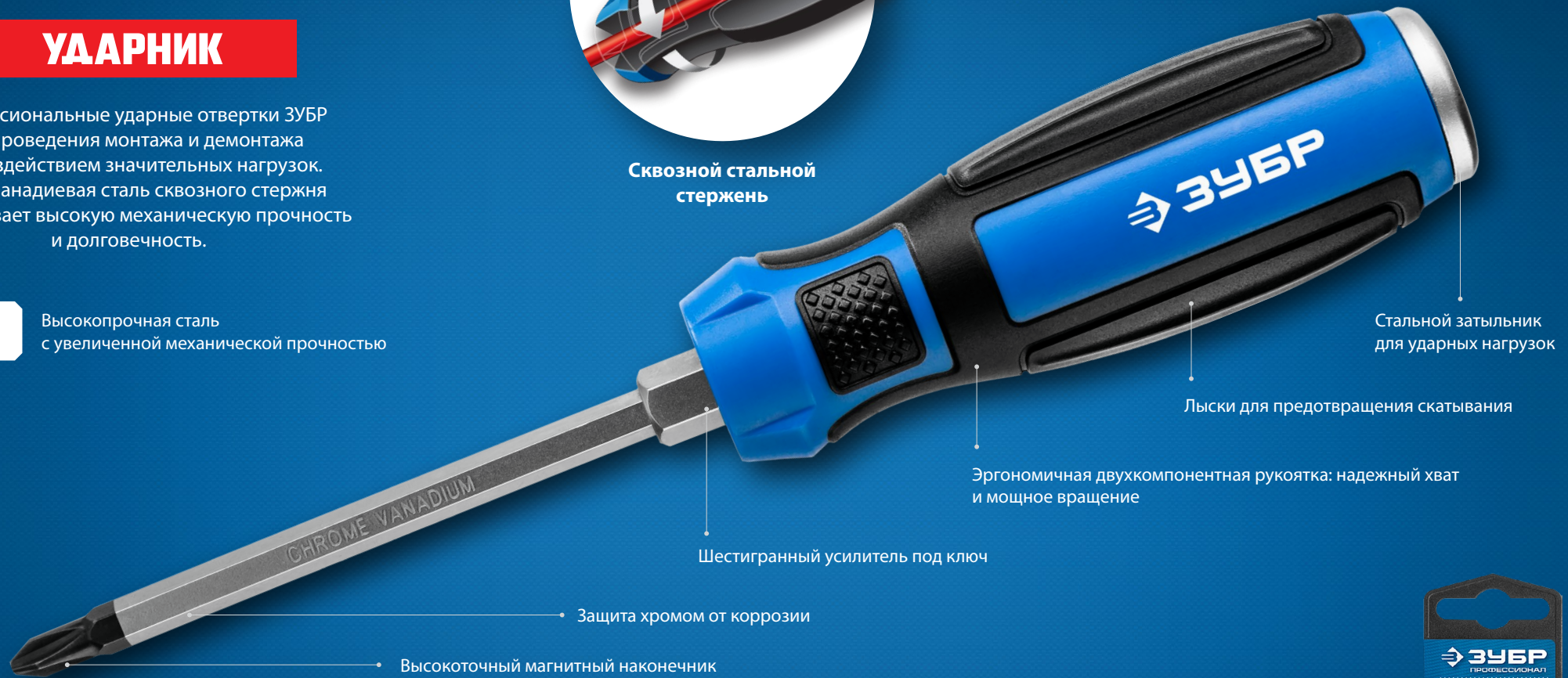
Стальной затыльник для ударных нагрузок