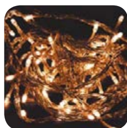
Теплый белый 2700K